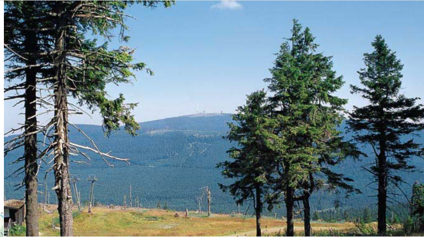
Blick vom Wurmberg zum Brocken.

Variante: Vom Dreieckigen Pfahl kann man auch direkt zurück nach Schierke gehen, ca. 60 Min. kürzer.