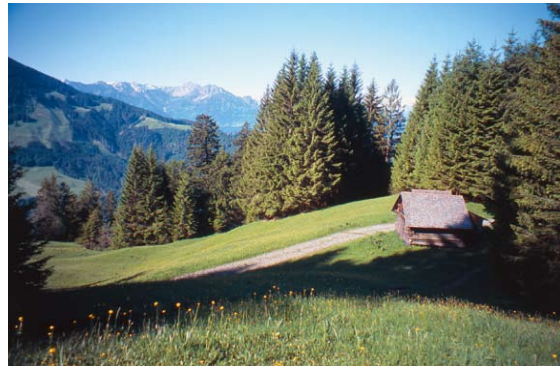
Zwischen Alpwegkopf und Bingadels

Für unseren Rückweg nach Laterns brauchen wir von da weg noch eine knappe halbe Stunde. Dabei führt der bequeme Weg durch schattigen Bergwald und zuletzt durch einen Wiesenhang zum Oberen Thal und im Verlauf des alten Kirchwegs zurück zum Ausgangspunkt bei der Pfarrkirche.