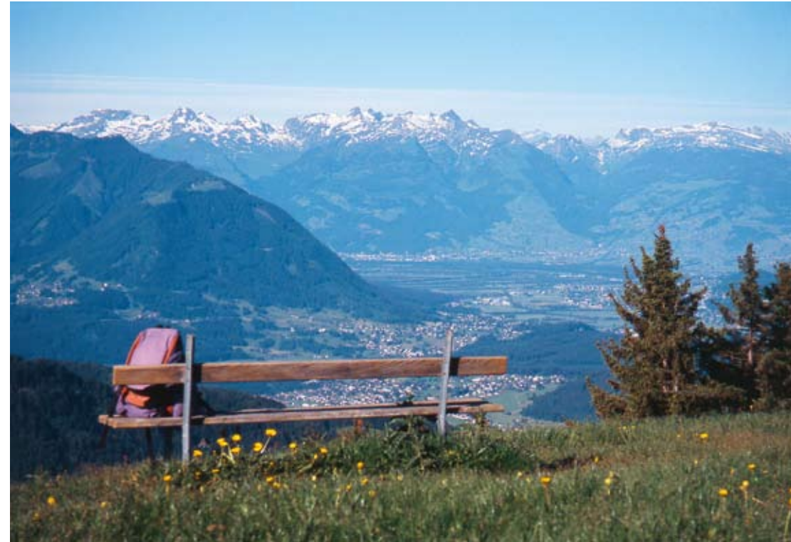
Ausblick vom Alpwegkopf ins obere Rheintal

Ausgangs- und Endpunkt der Rundwanderung ist Laterns-Thal , wo der Wegweiser bei der Pfarrkirche den kürzesten Weg zum früheren Ortskern im Oberen Thal zeigt. Auf der danach fast ebenen, dann allmählich ansteigenden Oberdorfstraße kommen wir zur Unteren Schwende , wo unsere Route bergwärts zu den Höfen der Oberen Schwende abbiegt. Unterwegs fällt auf, dass die in den höheren Lagen weniger gedüngten Bergwiesen zusehends artenreicher werden. Der an den Fahrweg anschließende Bergwanderweg