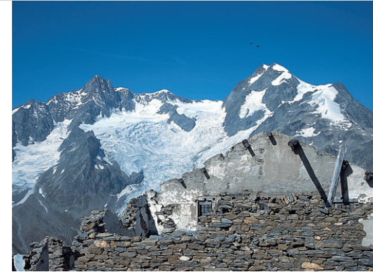
Hüttenruine auf dem Mont Fortin. Blick zur Aiguille de Trélatête, 3920 m.

Von Courmayeur fährt man mit der Gondelbahn zur Bergstation am Col de Chécrouit . Von hier an dem kleinen Segelflugplatz vorbei und hinauf zum schön gelegenen Lac Chécrouit , wo man die Markierung »TMB« (Tour du Mont Blanc) erreicht. Ihr folgt man bis zur Arp Vieille sup. , um in gleicher Richtung leicht aufwärts weiter nach Westen zu gehen; dann steil in eine