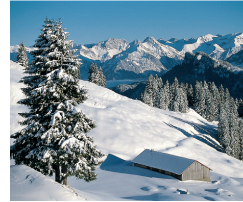
Piesenalp mit Aussicht in die Oberstdorfer Berge.

Variante: Will man nicht unbedingt die Riesenschleife zur Piesenalp legen, so liegt folgende, allerdings anstrengendere Abkürzungsmöglichkeit nahe: Sobald am Südwestfuß des Piesenkopfs ein Gebäude (Viehstall) erkennbar wird, über freie Hänge und einen Bachgraben querend zu diesem empor (Zeitersparnis ca. 0.20 Std.).