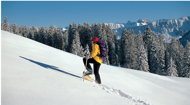
Unter der Piesenkapelle wird's allmählich steiler.

temperatur. Die unterschiedlich steile, aber stets angenehm steigende Fahrbahn ist im unteren Bereich meist geräumt.